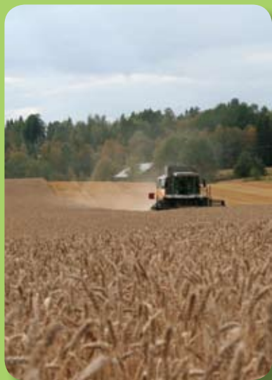
Növénytermesztési technológiák kereskedelme