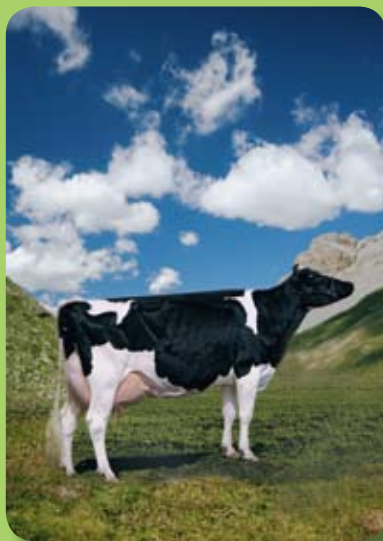
Állattenyésztési gépek és technológiák kereskedelme