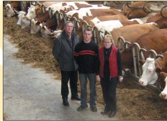
Schels-ék üzeme – Beilngriesben, Nürnberg mellett

Fény, levegő, kényelem és a munka megkönnyítése voltak az új, boxos kifutójú istálló tervezésének és kivitelezésének alap gondolatai. Az első két feltételt a komplett Agrotel Curtain System függönyrendszer valósítja meg, a második kettőt a fejőrobot és az Agrotel tehénmatracok. Az Agrotel tehénmatracok választásánál a bevált minőség és a kényelem volt a döntő.