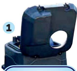
1 Példa a leeresztő dugó felőli nyílásra

Ez a kialakítás és az új nyitási rendszer lehetővé teszi az itató tetszőleges helyre történő beállítását anélkül, hogy fal vagy kapu akadályozná az itató könnyű nyitását.