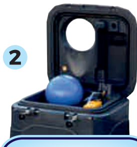
2 Példa a szelep felőli nyílásra