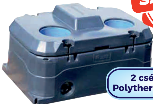
2 csészes Polytherme itató