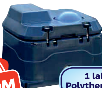
1 labdás Polytherme itató