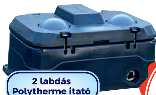
2 labdás Polytherme itató

Hőszigetelt itató: dupla falazás miatt hőszigetelő béléssel. Hőszigetelt fedél dupla tömítéssel és szigetelt labdával vagy csészével az állatok könnyű hozzáférése érdekében. A talaj természetes kalóriáit felszívja és -30^{\circ}\text{C} -ig pozitív hőmérsékleten tartja a vizet, magas hőmérséklet esetén pedig friss vizet biztosít.