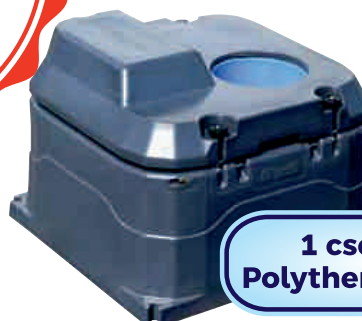
1 csészes Polytherme itató