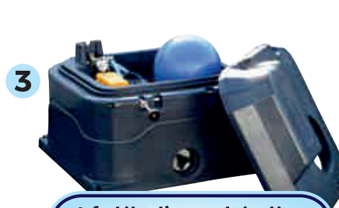
3 A fedél teljesen eltávolítva, hogy maximális hozzáférést biztosítson az itatóhoz.

A fedél bármikor átalakítható, lehetőséget biztosít a „labdás” kivitelről „csészes” kivitelben történő használatra és fordítva.