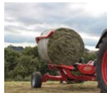
A hidraulikus rakodókar és az alacsony magasság biztosítja a bála gyors áthelyezését a karról a forgóasztalra.

A jobb oldalon a kifordítható keréktartó karral szerelt váz okos kialakítása biztosítja a nyomtáv növelését a területen és a maximális stabilitás elérését a bála rakodás során. A hidraulikus működésű rakodókar a gép jobb oldalán helyezkedik el és max. 1000 kg-os, 1.20 - 1.50m átmérőjű bálákat tud kezelni.