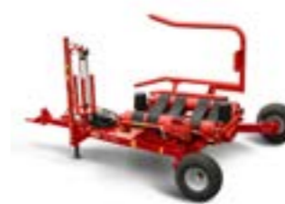
Vicon BW2400 Forgóasztalos bálacsomagoló, vontatott Maximális bálaméret: 1.20x1.50m