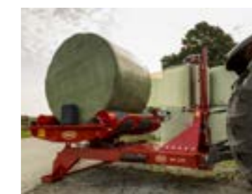
1200 kg-ig képes körbálát kezelni.