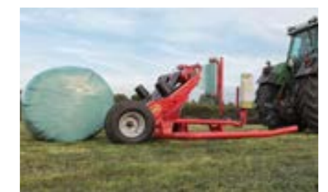
A gép alacsony kialakítása biztosítja a gyors és kíméletes lerakást.