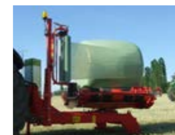
A bála- és rétegszámláló alapfelszereltség.

“ Opcionális távirányító – az egyszerű kezeléshez ”