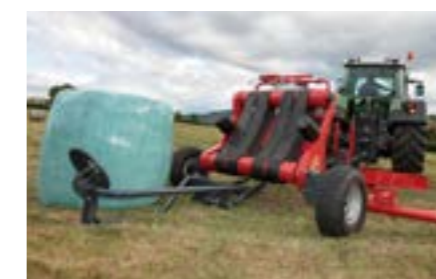
A Vicon forgóasztalos csomagolók felszerelhetők bálaátfordítóval.

A kerekek széles távolsága biztosítja forgóasztal kivételesen alacsony helyzetét. Így lehetővé válik az asztal billentése egészen addig, amíg szinte eléri a talajt, csökkentve a bála ejtési magasságát lerakáskor, biztosítva a becsomagolt bála lehető legkíméletesebb kezelését. Ezzel a megoldással csökken a fólia sérülésének az esélye, így normál körülmények között nincs szükség semmilyen csillapításra (zuhanásgátlóra vagy ponyvára).