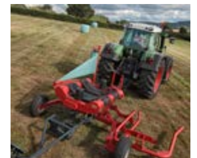
A forgóasztal a két hajtott hengerrel stabilan tartja és sima, egyenletes forgatást biztosít a báláknak.