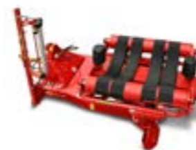
Vicon BW2100 Forgóasztalos bálacsomagoló, függesztett Maximális bálaméret: 1.20x1.50m