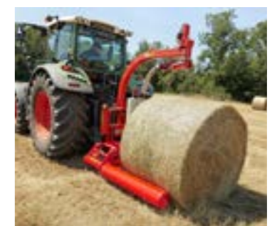
A BW2250 egy önrakó mechanizmussal rendelkezik ami kíméletesen veszi fel és rakja le a bálákat.