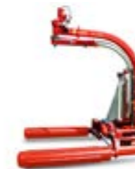
Vicon BW2250 Szatellit karos csomagoló, függesztett Maximális bálaméret: 1.20x1.50m