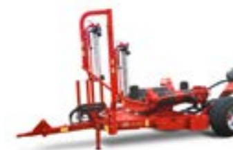
Vicon BW2600 Forgóasztalos bálacsomagoló, vontatott Maximális bálaméret: 1.20x1.50m