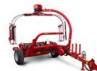
Vicon BW2850 Szatellit karos csomagoló, vontatott Maximális bálaméret: 1.20x1.50m