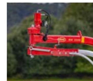
Erős szatellit hajtáslánc.

Az éles késekkel ellátott ollós megoldású fóliavágó az alapfelszereltség része a szatellit karos csomagolókon és ez tiszta, egyenes vágást biztosít a fólia teljes szélességében.