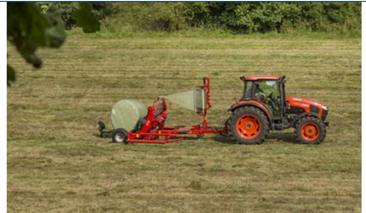
A rakodókar teljesen leengedésre kerül a talajra, hogy kiemelje a kereket, így az könnyen átfordítható a munkahelyzetből a szállítási pozícióba.

“ Biztosítson maximális szenázs minőséget ”