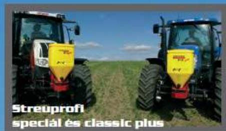
Streuprofil speciál és classic plus