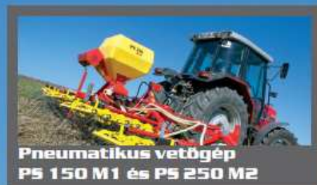
Pneumatikus vetőgép P5 150 M1 és P5 250 M2