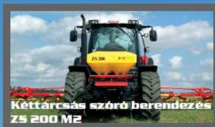
Kéttárcsás szóró berendezés ZS 200 M2